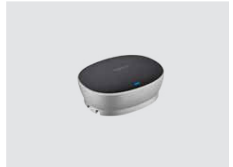
ANSCHLUSSMÖGLICHKEITEN UND VERWENDUNG

Erweitern Sie den Gesprächsbereich von 6 m (20 Fuß) auf 8,5 m (28 Fuß), damit auch die von der Freisprecheinrichtung weiter entfernten Personen deutlich gehört werden. Mikrofone (paarweise verfügbar) werden automatisch erkannt und konfiguriert, indem Sie sie einfach an die Freisprecheinrichtung anschließen.